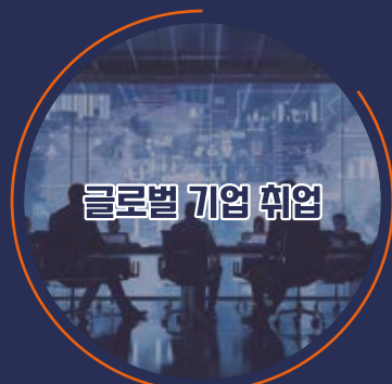
글로벌 기업 취업 ITU 인턴십, APNIC/APriGF 펠로우 활동