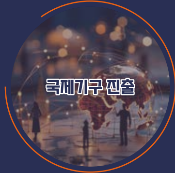
국제기구 진출 ITU, ICANN, APNIC, ISOC 등

APIGA 수료생 약 50% 는 국제기구, 글로벌 기업, 국제포럼 등 관련 분야에서 활동 중