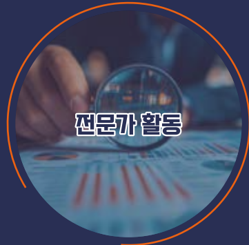
전문가 활동 거버넌스 연구 및 국내외 포럼 활동(IGF, APriGF, KriGF)